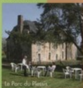
Le Parc du Plessis